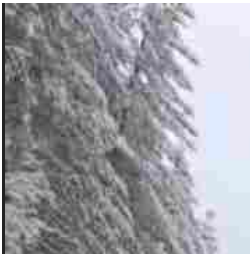
Freddo e maltempo in Calabria: Sila sommersa dalla neve