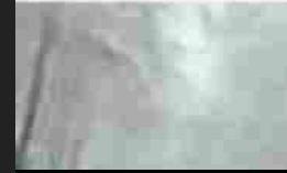
Tanta neve in Sila